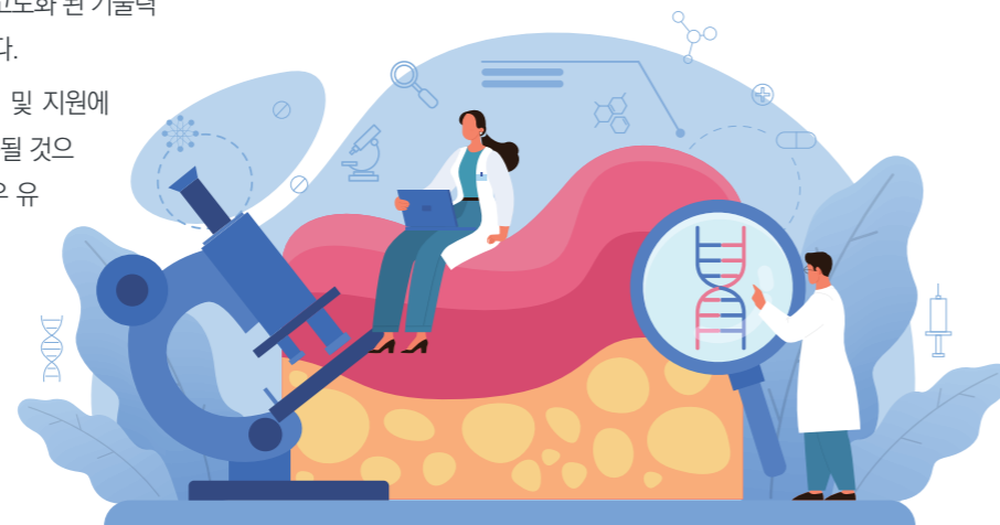
그림 2 세포치료제 시장의 신 사업기회 분석

① 지속적 R&D 투자전략 수립: 동산업의 경쟁강도가 높지 않음을 고려, 기술 혁신을 통한 우위 확보는 사업화 성공에서의 Key point로 분석된다. 따라서 장기간·다수의 R&D 수행에 대한 비용적 리스크를 최소화할 수 있는 전략을 체계적으로 수립할 필요가 있다.