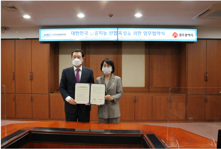
KISTI 최희운 원장(오른쪽)과 광주광역시 이용섭 시장